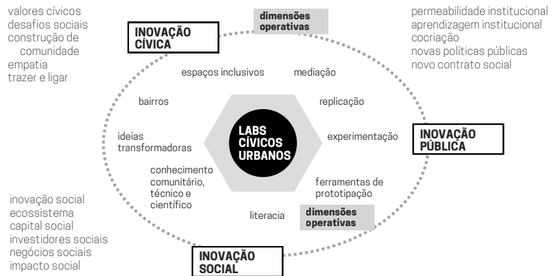
Figura 1: As dimensões operativas e conceituais dos Laboratórios Cívicos Urbanos

Este instrumento de inovação cidadã, focado na ativação comunitária e da inteligência coletiva que aquela detém, emerge num quadro mais global de inovação social e de inovação pública. Mais centrado em inovação de impacto, o laboratório envolve organizações do terceiro setor e da administração pública que comungam dos mesmos princípios de desenvolvimento, de conhecimento e de capacitação dos envolvidos, colocando-os no papel de protagonistas, mais do que no de apenas beneficiários.