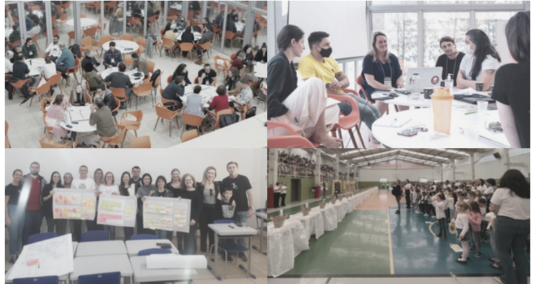
Figura 1: Registros de atividades públicas do LabIC Novale