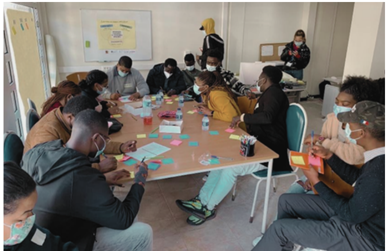
Figura 3: Workshop Colaborativo LabIC Aveiro

Para muitos membros da comunidade acadêmica não é evidente o esforço que os alunos africanos têm de fazer. Chegam a um país desconhecido e iniciam sozinhos uma vida nova num contexto mais fechado e individualista, que contrasta com o ambiente comunitário e familiar onde cresceram. Ao contrário dos seus pares portugueses, o apoio familiar não está à distância da viagem de fim de semana: há muitos alunos que passam anos sem regressar a casa e rever os familiares e amigos.