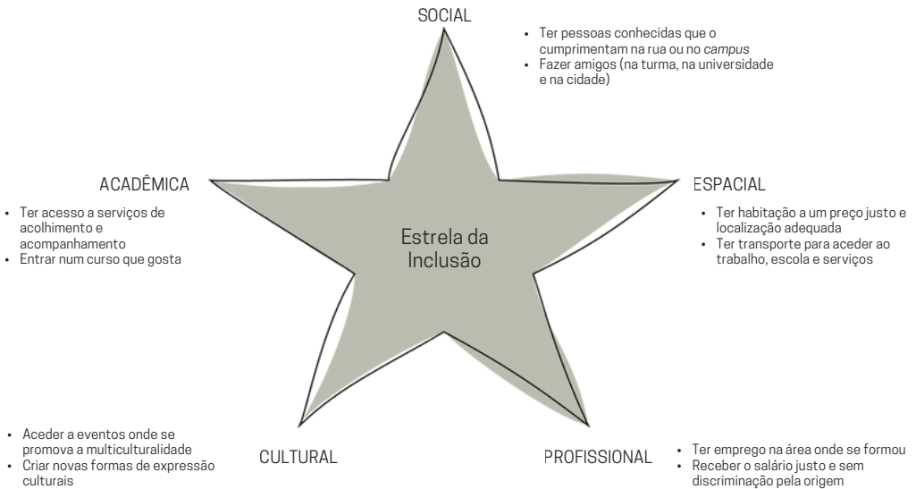
Figura 2: Pilares da inclusão

Por último, o acesso a produtos alimentares dos países de origem contribuiu para manter as ligações culturais e oferece conforto.