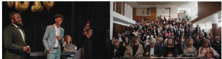
Figuras 6 e 7: Gala LABIC